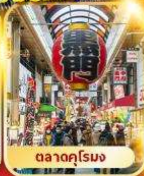
ตลาดคุโรมง