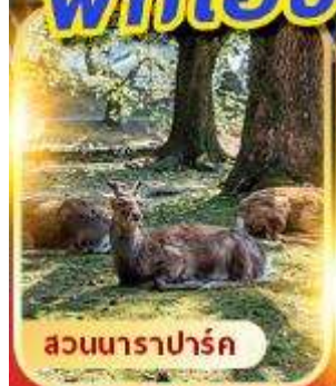
สวนนาราปาร์ค