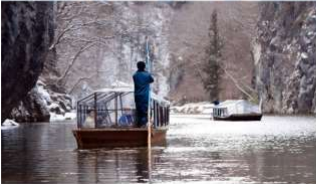
VISIT GEIBIKEI GEORGE