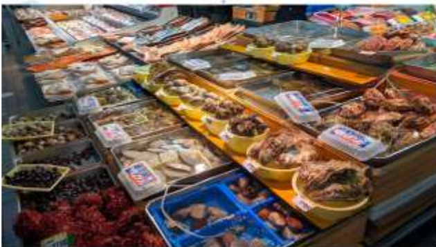
VISIT HASSHOKU CENTER

ตลาดปลา “อิชโชคุ เซ็นเตอร์” เป็นตลาดอาหารทะเลขนาดใหญ่ มีร้านค้ากว่า 60 ร้านเรียงรายกันเต็มไปหมด อาทิ อาหารทะเลสดๆ ผักผลไม้ และของฝากมากมาย ท่านสามารถเลือกซื้อวัตถุดิบที่ชอบไปปรุงอาหารเอง หรือจะเลือกซื้ออาหารทะเลที่ปรุงสุกแล้วก็ได้ ทำให้ท่านรู้สึกได้ลิ้มลองรสชาติความสดหวานของอาหารทะเลอย่างแท้จริง