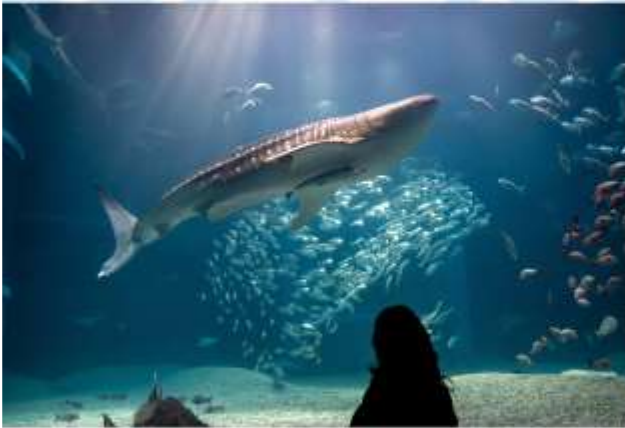
VISIT KAIYUKAN AQUARIUM

เดินทางสู่ "นครโอซาก้า" เมืองแห่งรอยยิ้มและอาหารอร่อยเต็มไปด้วยชีวิตชีวาและวัฒนธรรมอันเป็นเอกลักษณ์ของญี่ปุ่น ตั้งอยู่บนเกาะฮอนชู เป็นเมืองที่มีขนาดเศรษฐกิจใหญ่เป็นอันดับ 2 และมีประชากรมากเป็นอันดับ 3 ของประเทศ