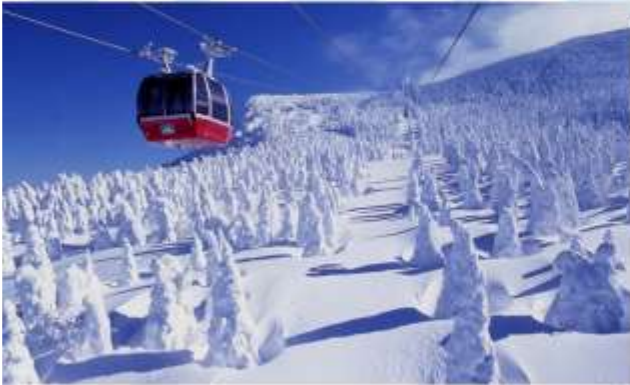
TRNF TO MT.ZAD ROPWAY/SNOW MONSTER