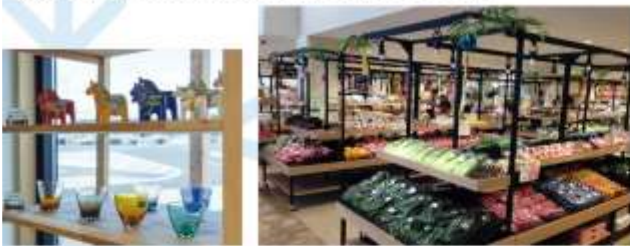
SHOP AT GOOD YAMAGATA & MICHINOEKI ZAO

อิสระช้อปปิ้ง “มิชิโนะเอกิ ซาโอะ” ตลาดเกษตรกรของแท้ที่จำหน่ายผลิตภัณฑ์ในท้องถิ่นหลากหลายประเภท เป็นสถานที่พิกัดรวมทางที่มีชื่อเสียงและเป็นประตูสู่ภูเขาซาโอะ หนึ่งในแลนด์มาร์คสำคัญของจังหวัดยามาغاتะ