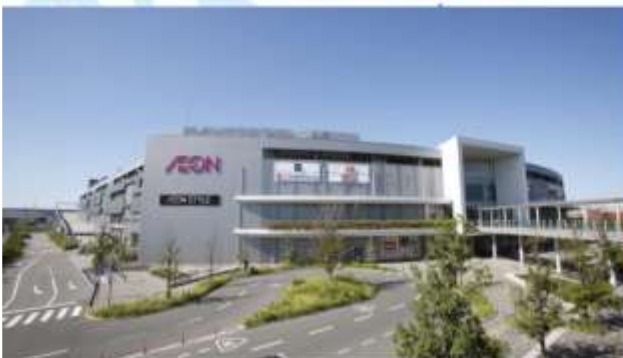
SHOPPING AT AEON MALL RINKU SENNAN/TSUKIGESHO FACTORY