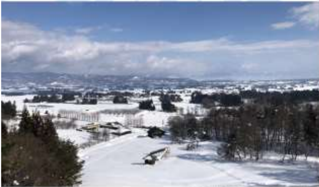
VISIT IDE DONDEN DAIRA SNOW