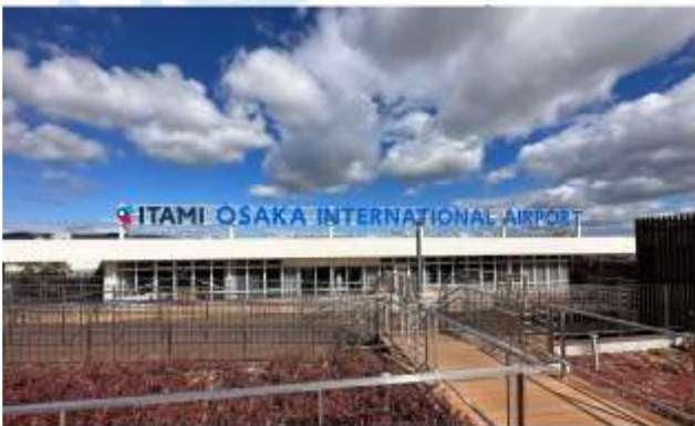
TRNF TO ITAMI AIRPORT/FLY TO YAMAGATA AIRPORT

เดินทางสู่ "สนามบินอิตามิ" ออกเดินทางสู่ "สนามบินยามางาตะ" โดยสายการบินเจแปนแอร์ไลน์ เที่ยวบินที่ JL 2237 (15.50 น.-17.00 น.)