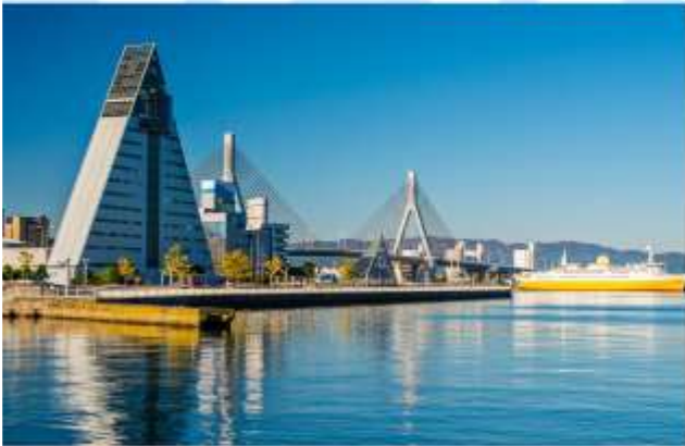
TRNF TO AOMORI