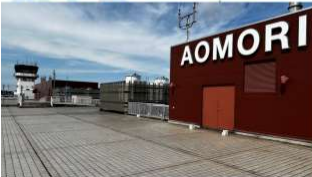
TRNF TO AOMORI AIRPORT/FLY TO ITAMI AIRPORT

เดินทางสู่ "สนามบินอาโอโมริ" ออกเดินทางสู่ "สนามบินอิตามิ" โดยสายการบินเจแปนแอร์ไลน์ เที่ยวบินที่ JL 2154 (13.55 น.-15.35 น.)