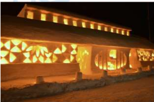
VISIT YUKI HATAGO FESTIVAL

พิเศษ!!! สุดตระการตา กับ “Yuki Hatago Festival” หรือ “เทศกาลกระท่อมหิมะส่องแสง” เป็นงานเทศกาลฤดูหนาวที่จัดขึ้นที่เมืองยามาغاتะ โดยจะจัดขึ้นในช่วงปลายเดือนกุมภาพันธ์ถึงต้นเดือนมีนาคมของทุกปี เทศกาลนี้จะพาท่านไปสัมผัสกับความงดงามของหิมะและแสงไฟในบรรยากาศที่โรแมนติก อีกทั้งยังได้เข้าไปในกระท่อมหิมะ หรือดื่มเครื่องดื่มใน Ice Bar เป็นประสบการณ์ที่หาได้ยากมาก