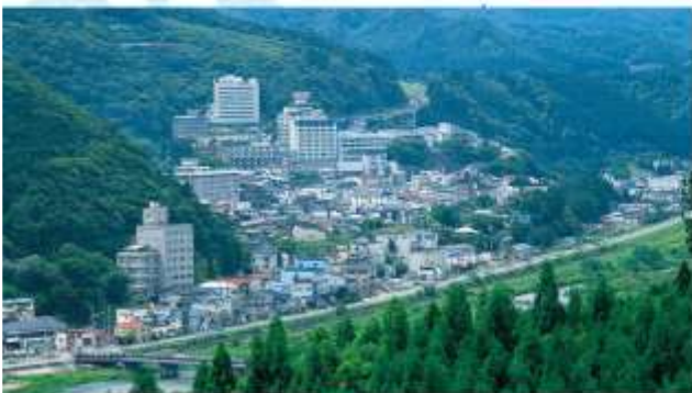
TRNF TO NARUKO ONSEN

"นารุโตะ ออนเซ็น" เป็นหนึ่งในสาม ออนเซ็นที่โด่งดังที่สุดในภูมิภาคโทโฮคุ มีประวัติศาสตร์ยาวนานกว่า 1,000 ปี และมีบ่อน้ำพุร้อนมากกว่า 400 แห่ง น้ำพุร้อนที่นี่มีคุณสมบัติทางยาหลากหลายชนิด และบรรยากาศที่เงียบสงบอีกด้วย