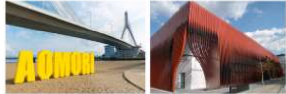
อิสระอาหารกลางวัน ณ กิตดาการ

"A-FACTORY" แหล่งรวมสินค้าและประสบการณ์สุดพิเศษ ตัวอาคารมีดีไซน์ทันสมัย ตั้งอยู่ริมทะเล ทำให้มีวิวที่สวยงาม เหมาะแก่การพักผ่อนและถ่ายรูป ตลาดขนาดใหญ่ที่รวบรวมสินค้าท้องถิ่นหลากหลายชนิด โดยเฉพาะอย่างยิ่ง ผลิตภัณฑ์จากแอปเปิ้ล ซึ่งเป็นผลไม้ขึ้นชื่อของจังหวัดอาโอโมริ