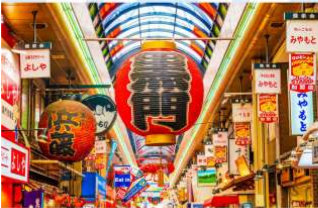
VISIT KURUMON FISH MARKET