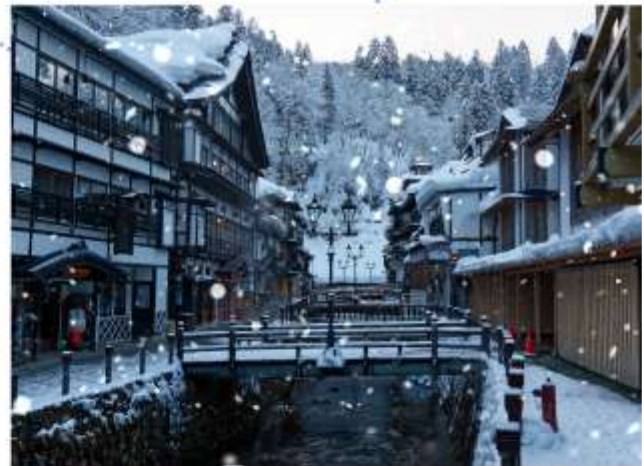
VISIT GINZAN ONSEN