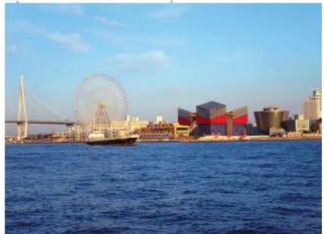
VISIT TEMPOZAN MARKET PLACE