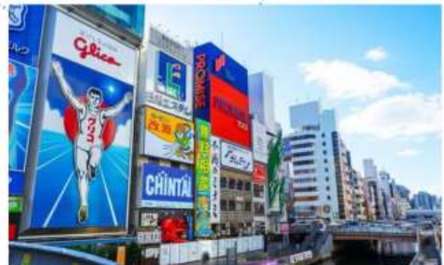
SHOPPING AT SHINSAIBASHI

“โรงงานชิกิกะโช” ชมมินิรูสมน ของฝากสุดคลาสสิกจากโอซาก้า มีขนมหวานมากกว่า 100 ชนิด รวมถึงขนมและเค้กญี่ปุ่น ท่านสามารถเพลิดเพลินกับการช้อปปิ้งขนมหวานได้ตามใจชอบ