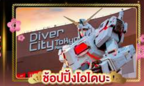
ช้อปปิ้งโอโดบะ

สายการบิน Full service พร้อมอาหารบนเครื่อง