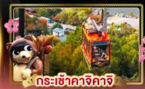
กระเช้าคางิคาจิ