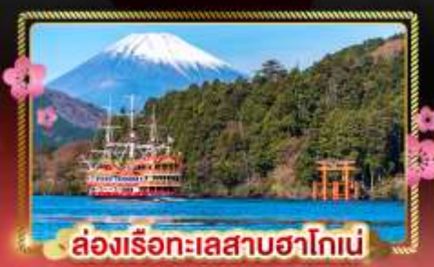
ล่องเรือทะเลสาบฮาโกเน่