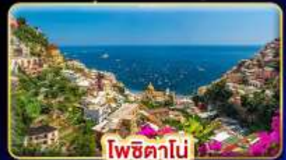
โพซิทานิ