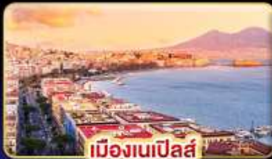
เมืองเนเปิลส์