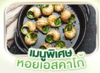
เมนูพิเศษ หอยแอสคาดี

พิเศษ ล่องเรือแม่น้ำแซนชมเมือง โดย บาโต มูช