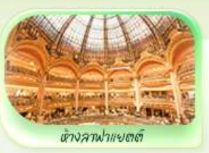
วังหลวงเก่า