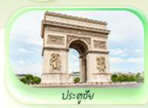
ประตูชัย