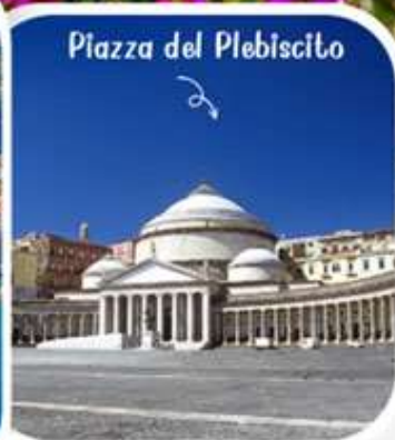
Piazza del Plebiscito