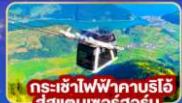
กระเช้าไฟฟ้าคานริโอ สู่สแตนเซอร์ฮอร์น

พิเศษ! พิเศษยอดเขาดีอาไวเลซซา พร้อมเมนูกะเพราไทย