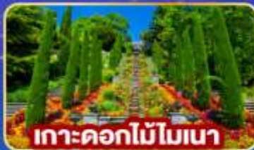
เกาะดอกไม้โมเนนา