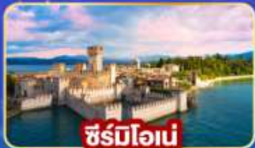
ซีร์บิโอนี