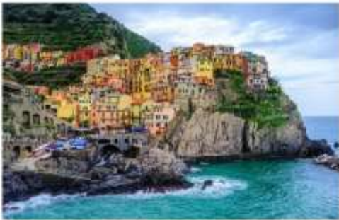
ซิงเคว เทเร

จากนั้นนำท่านเดินทางต่อด้วยรถไฟ สู่หมู่บ้านมรดกโลกและอุทยานแห่งชาติ ซิงเคว เทเร Cinque Terre อ่านว่า ซิงเควเทเร หรือแปลในความหมายตามภาษาอังกฤษก็คือ The Five Land แดนมหัศจรรย์ทั้ง 5 ที่ประกอบกันขึ้นมาเป็นดินแดนแห่งความงดงาม หมู่บ้านเล็กๆ 5 หมู่บ้านที่ซ่อนตัวอยู่ห่างไกลจากสายตาของคนภายนอก แผ่นดินที่ยากจะเข้าถึงได้โดยง่าย หมู่บ้านเล็กๆ 5 หมู่บ้านที่ตั้งเรียงอยู่มีห่างกัน