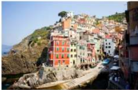
ซิงเคว เทเร