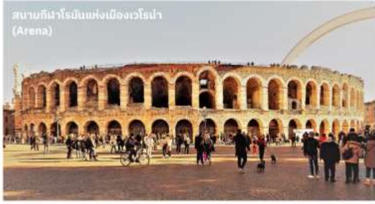
สนามกีฬาโรมันแห่งเมืองเวโรนา (Arena)