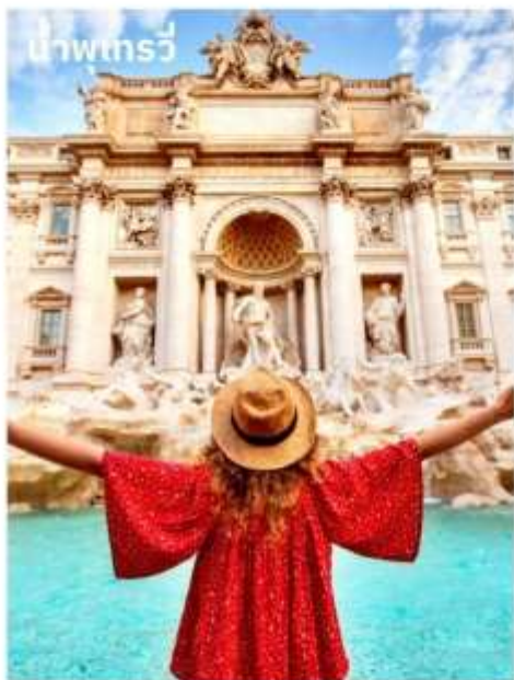
น้ำพุเทรวี

จากนั้นอิสระตามอัธยาศัยกับการเลือกซื้อสินค้าแฟชั่นและของที่ระลึกในบริเวณย่าน บันไดสเปน (The Spanish Step) ซึ่งเป็นแหล่งแฟชั่นชั้นนำสุดหรูและยังเป็นแหล่งนัดพบของชาวอิตาเลียน