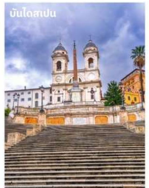
บันไดสเปน