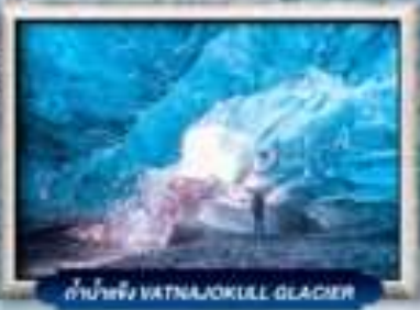
ดำน้ำแข็ง WATNAJOKULL GLACIER

บินทรู สายการบิน Full Service | พิเศษ! ทานอาหารโคตรจกครัว 360 องศา