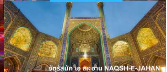
จัตุรัสบัก ออ ฉะฮาน NAQSH-E-JAHAN