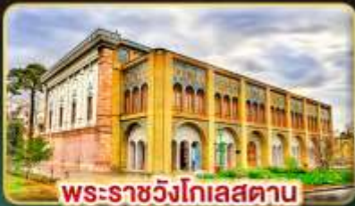
พระราชวังโกเลสถาน

เยือนอารยธรรมเปอร์เซีย เก็บครบทุกไฮไลต์สำคัญ