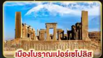
เมืองโบราณเปอร์เซโปลิส

บินตรง กรุงเทพฯ - เตหะราน บินภายใน ชีราซ - เตหะราน