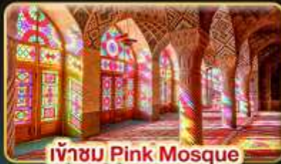
เข้าชม Pink Mosque