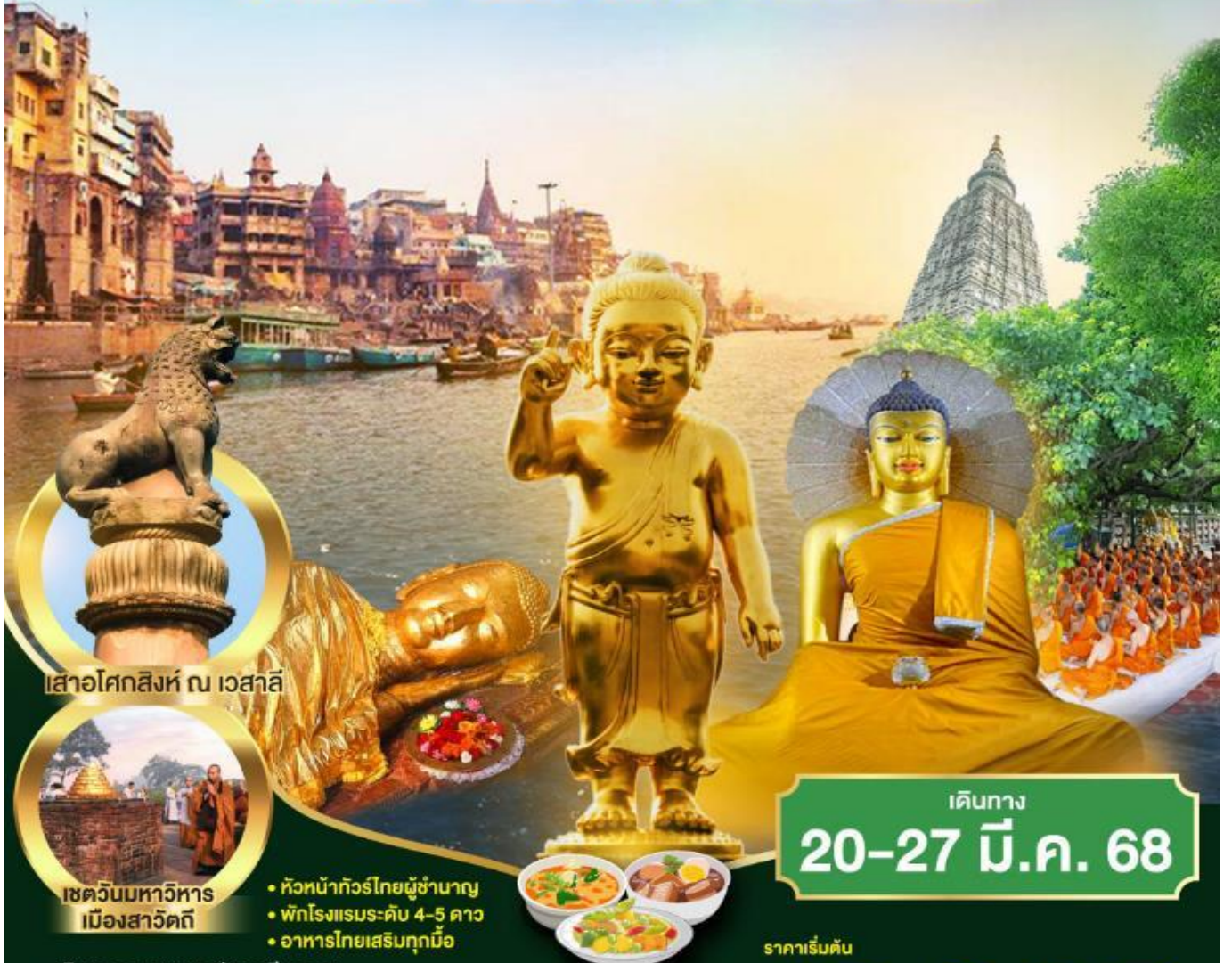
เสาอโศกสิงห์ ณ เวสาลี