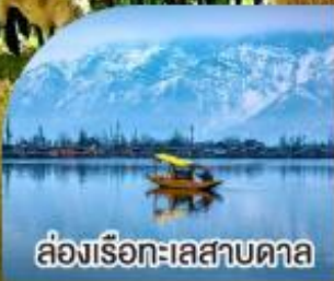
ล่องเรือทะเลสาบคาล