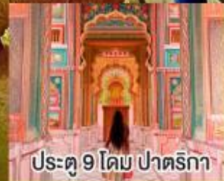
ประตู 9 โดม ปาตริกา