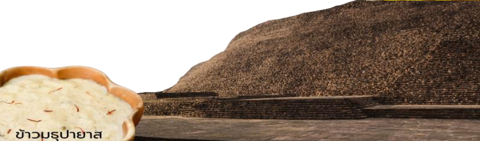
ข้าวมธุปายาส