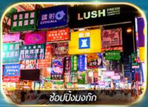
ช้อปปิ้งมงก๊ก

เต็มอิ่มทั้งบุญ และ ช้อปปิ้งแบบจัดเต็ม จิมซาจุ้ย มงก๊ก