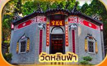
วัดหลินฟา