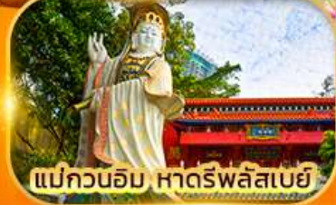
แม่กวนอิม หาดรีพลัสเบย์