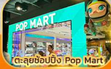
ตะลุยช้อปปิ้ง Ping Pop Mart