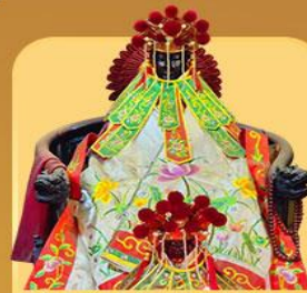
เจ้าแม่กวนอิมสองขำ