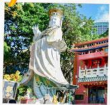
เจ้าแม่กวนอิมรพัสลัมย์

23 กุมภาพันธ์ 2568 วันเยี่ยมเงินเจ้าแม่กวนอิม วัดสองอำ