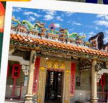
วัดปึกไต่