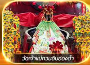
วัดเจ้าแม่กวนอิมฮ่องกง