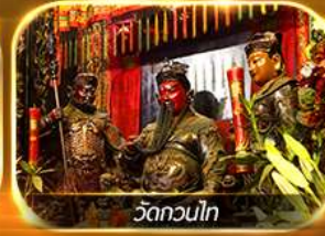
วัดกวนไท

ไหว้ 8 เซียนวัดดัง ปิงไม่หยุด ครบถ้วน!! การเงิน การงาน ความรัก และสุขภาพ นั่งรถราง PEAK TRAM, ชมวิวยอดเขาวัดตอเรีย, เจ้าแม่กวนอิมหาดริฟลอสปี, วัดหลินฟ้า, วัดเจ้าแม่ทับทิม, วัดหวังต้าเซียน, วัดกวนไท, วัดฮ่องกง, วัดเข่งหมิว, กระเช้านองปิง 360, พระโหรงเหียงทาน