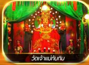
วัดเจ้าแม่ทับทิม