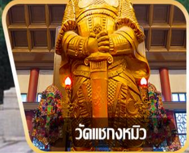
วัดเขangkงหมี