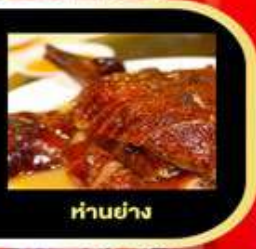
LEI YUE MUN