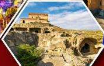
เมืองดำอโพลิสตซึเคห์