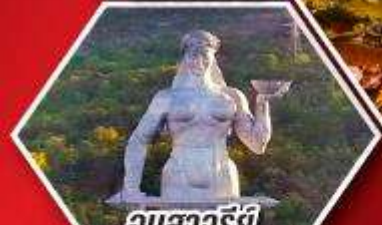
อนุสาวรีย์