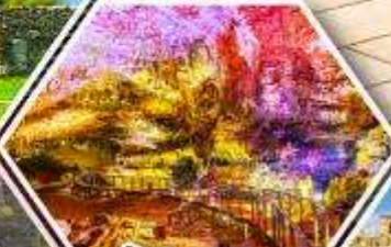
ดักไฟรมีริอุส