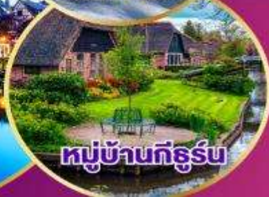
หมู่บ้านกีธูร์น