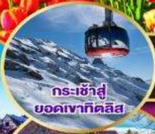
กระเช้าสู่ยอดเขาทาคาลิส