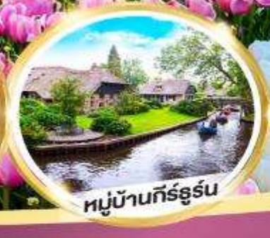
หมู่บ้านกิร์ธูร์น