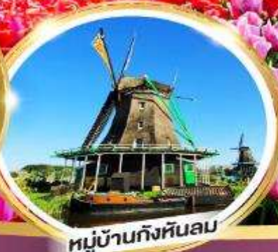
หมู่บ้านกังหันลม