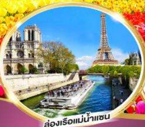
ล่องเรือแม่น้ำแซน