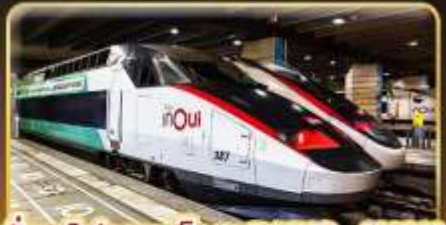
นั่งรถไฟความเร็วสูง PARIS - LYON