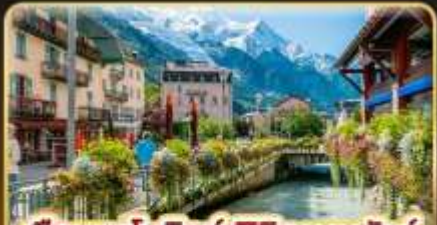
เยือนซาโมเน็กซ์ พิชิตมงบล็องก์