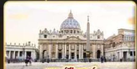
เซนต์ปีเตอร์