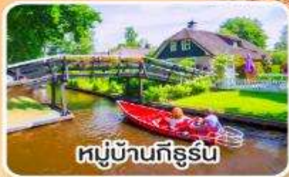
หมู่บ้านกิธูร์น