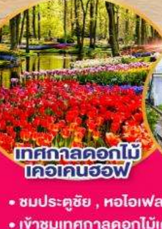
เทศกาลดอกไม้ เคอเคนฮอฟ