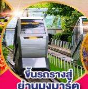
ชั้นรถรางสู่ ย่านมงมาร์ต