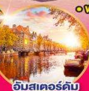
อัมสเตอร์ดัม