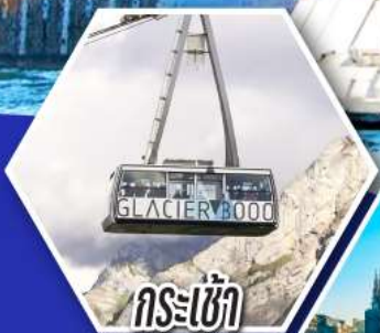
กระเช้า กลาเซียร์ 3000