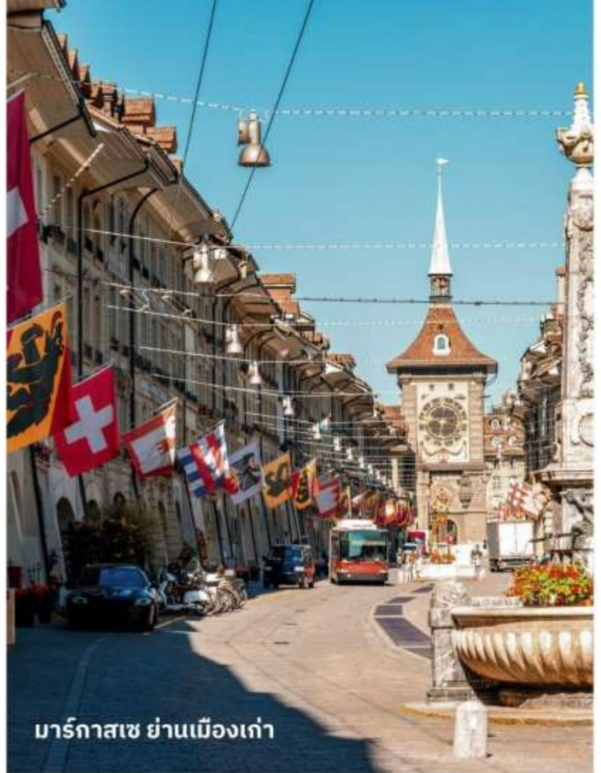
มาร์กาซเซ ย่านเมืองเก่า

ปัจจุบันเต็มไปด้วยร้านดอกไม้และบูติก เป็นย่านที่ปลอดภัยจนดี จึงเหมาะกับการ เดินเที่ยวชมอาคารเก่า อายุ 200-300 ปี