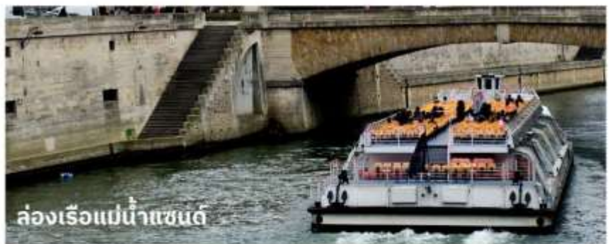
ล่องเรือแม่น้ำแซนต์

จากนั้นนำท่าน ล่องเรือบาโตมุซ (Bateaux Mouches River Cruise) เรือล่องไปตามแม่น้ำแซน ที่ไหลผ่านใจกลางกรุงปารีส ชมความสวยงามของสถาปัตยกรรมอันคลาสสิกของอาคารต่างๆ