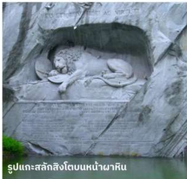
รูปแกะสลักสิงโตบนหน้าผาหิน

จากนั้นนำท่านเดินทางสู่ เมืองแองเกลเบิร์ก เพื่อนั่งกระเช้าหิมะแห่งแรกของโลกสู่ ยอดเขาคัทลิส (TITLIS) แหล่งเล่นสกีของสวิสเซอร์แลนด์ภาคกลาง ที่หิมะคลุมตลอดทั้งปี สูงถึง 10,000 ฟุต หรือ 3,020 เมตร บนยอดเขาแห่งนี้หิมะจะไม่ละลายตลอดทั้งปี นั่งกระเช้ายักษ์ที่หิมะได้รอบทิศเครื่องแรกของโลกที่ชื่อว่า REVOLVING ROTAIR จนถึงสถานีบนยอดเขาคัทลิส