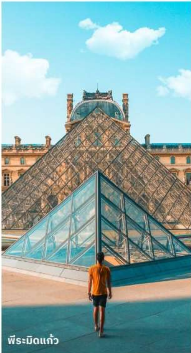
พีระมิดแก้ว

เดินทางสู่ พิพิธภัณฑ์ลูฟร์ ให้ท่านได้ถ่ายรูปด้านหน้า พีระมิดแก้วของพิพิธภัณฑ์ลูฟร์ เป็นพิพิธภัณฑ์ทางศิลปะที่มีชื่อเสียงที่สุด เก่าแก่ที่สุดและใหญ่ที่สุดแห่งหนึ่งของโลก