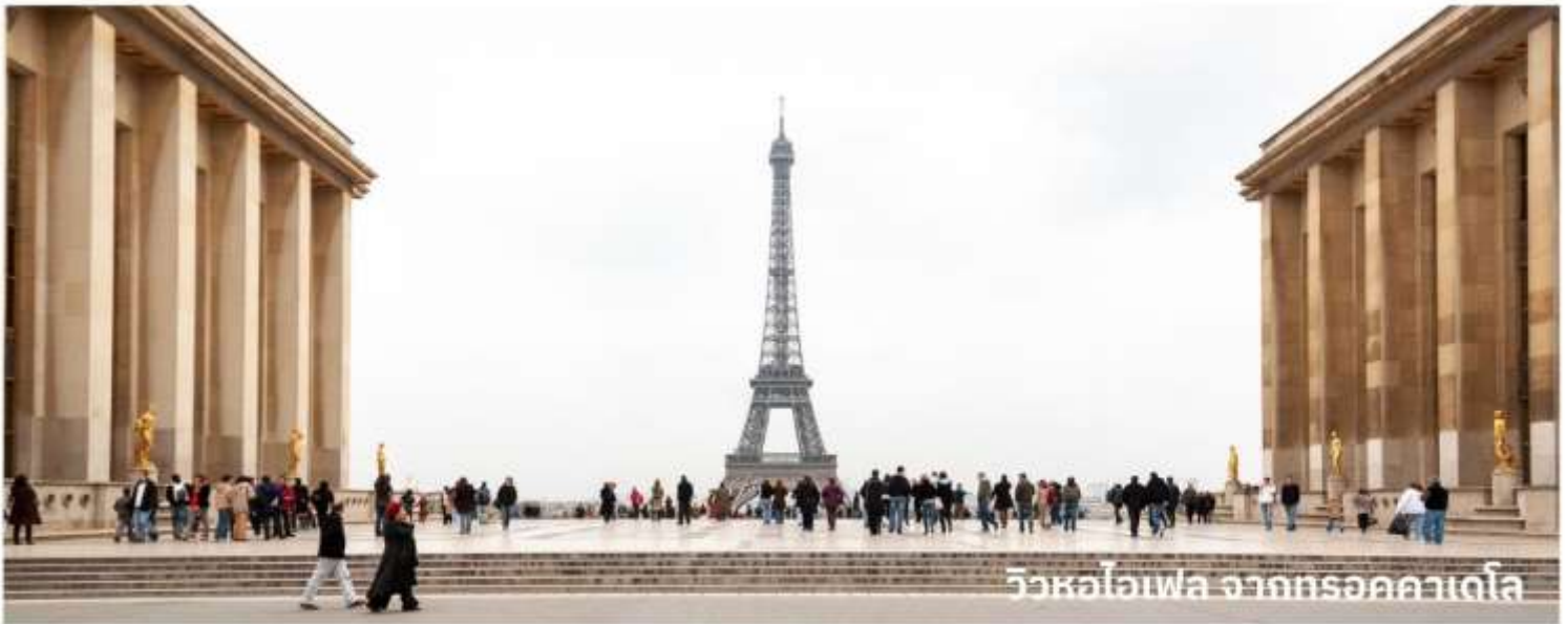
วิวหอไอเฟล จากมรดกคาเดไล