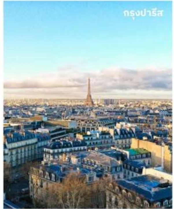
กรุงปารีส

บริการอาหารเช้า ณ ห้องอาหารของโรงแรม หลังจากนั้นนำท่านเดินทางสู่ La Vallee Village Outlet ใช้เวลาเดินทางประมาณ 1 ชั่วโมง แหล่งช้อปปิ้งที่รวมร้านค้าแบรนด์เนมดังมากมาย กว่า 70 ร้าน สัมผัสประสบการณ์การช้อปปิ้งที่ ครบครันด้วยสินค้าชั้นนำต่าง ๆ มากมาย เช่น CELINE, KENZO, LONGCHAMP, POLO, BLANC BLEU, FRANCOIS, DIESEL GIRBAUD, PAUL SMITH, BURBERRY, VALENTINO, VERSACE, KEVIN KLEIN, SAMSONITE, ARMANI, CERRUTI, DOLCE & GABBANA, GIVENCHY ฯลฯ