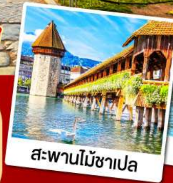
สะพานไม้ซาเปล

11-19 ก.พ. 68 08-16, 15-23 มี.ค. 68 09-17 เม.ย. 68