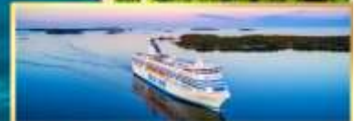
เรือ Tallink Silja Line