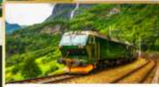
รถไฟสายฟลิ้มसान่า