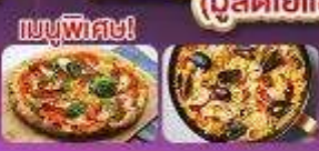
เมนูพิเศษ!