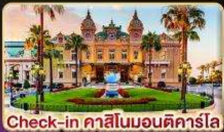
Check-in คาสีโนมอนติคาร์โล