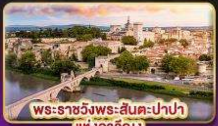
พระราชวังพระสันตะปาปาแห่งอเวียง