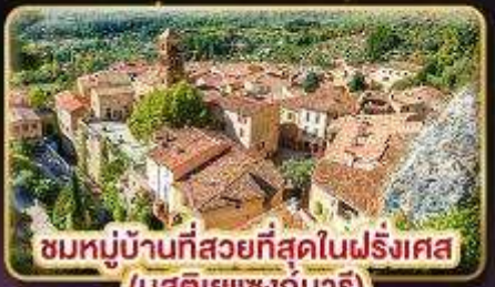
ชมหมู่บ้านที่สวยงามที่สุดในฝรั่งเศส (บูสตีเยแซงท์มาร์)