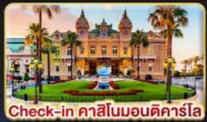
Check-in คาสิโนมอนติคาร์โล