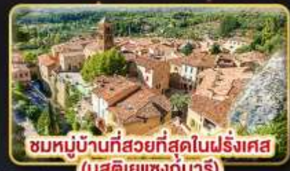
ชมหมู่บ้านที่สวยงามที่สุดในฝรั่งเศส (บูสตีเยแซงท์มารี)