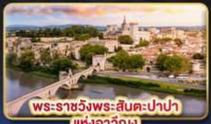
พระราชวังพระสันตะปาปา แห่งอเวัญง