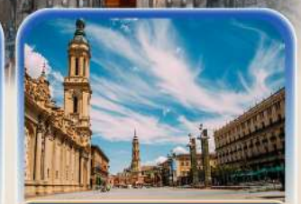
จัตุรัสพลาซ่า เดล ฟาร์