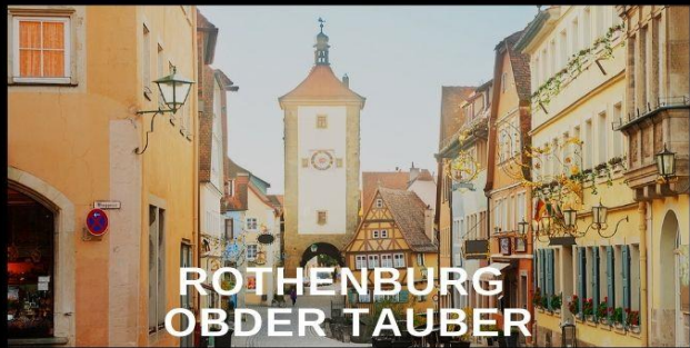
ROTHENBURG OBDER TAUBER