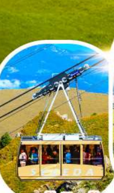
กระเช้าซิคเคต้า