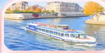
ล่องเรือแม่น้ำเซน