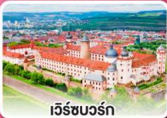
เวิร์ชบวร์ค