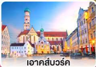
เอาคส์บวร์ค