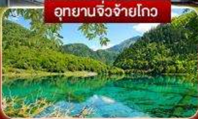
อุทยานจิ่งจ้ายโกว