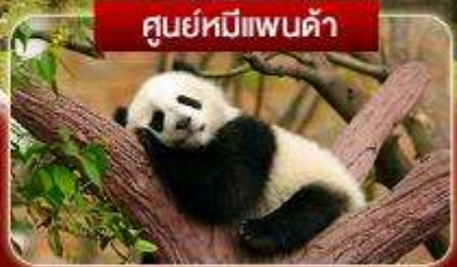
ศูนย์หมีแพนด้า

เดินทาง สัตว์ป่า หุบเขาของเอียวโกว จิ่งจ้ายโกว เม่าเสี้ยน กระเช้าขึ้นภูเขาคิมะต้ากู่การ์เซีย รถไฟความเร็วสูงกลับเมือง แพนด้าซลฟี ไท่กู่ลี ศูนย์แพนด้า แพนด้าปิ่นตึก IFS ซุนซีลู่ ซอยกว้างแคบ ชมแสงไฟลานห้าง SKP วัดต้าอ้อ