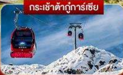
กระเช้าต้ากู่การ์เซีย