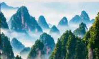
เขาวงตาร

*ทางบริษัทฯ ขอสงวนสิทธิ์ในการสลับโปรแกรมทัวร์ตามความเหมาะสมขึ้นอยู่กับสถานการณ์ปัจจุบัน โดยทำมิ้งถึงผลประโยชน์ของลูกค้าเป็นสำคัญ