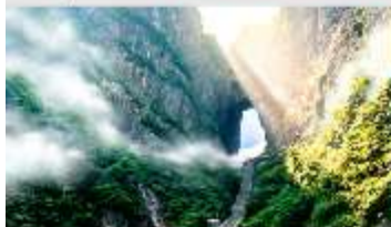
ประตูลั่ว