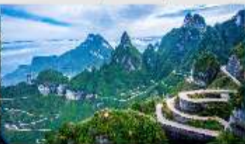
ถนน 99 โค้ง