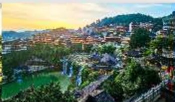
เมืองโบราณฝูหรงเจิน