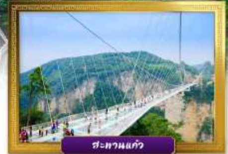
สะพานแก้ว