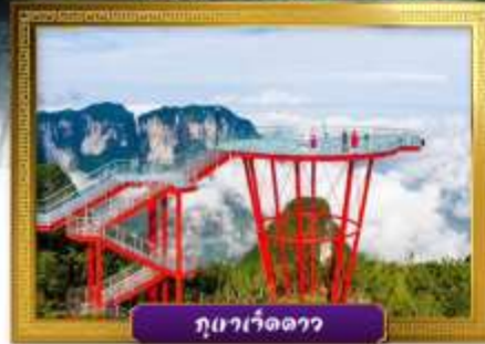
ภูเขาวังเจ็ดดาว

✓ เดินเล่นถนนคนเดินหลงซิงลู่และซีปู้เจีย