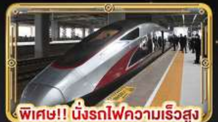
พิเศษ!! นั่งรถไฟความเร็วสูง