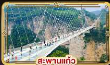
สะพานแก้ว