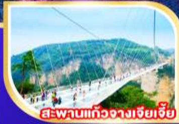
สะพานแก้วจางเจียเจีย