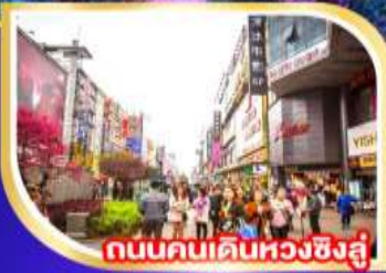
ถนนคนเดินหวงซิงอู่