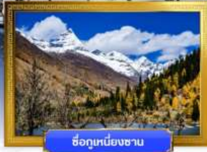
ชื่อภูเขาหิมะชาน