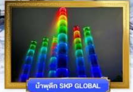
น้ำพุตึก SKP GLOBAL