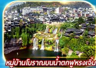
หมู่บ้านโบราณบนน้ำตกฟุหลงเจิน