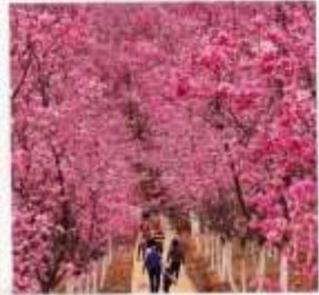
หุบเขาซากระหมื่นลี