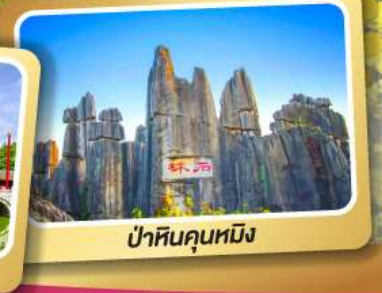
ป่าหินคุณหมิง