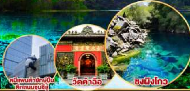
หมีแพนด้ายักษ์ปิ่น ตึกถนนซุนชี่