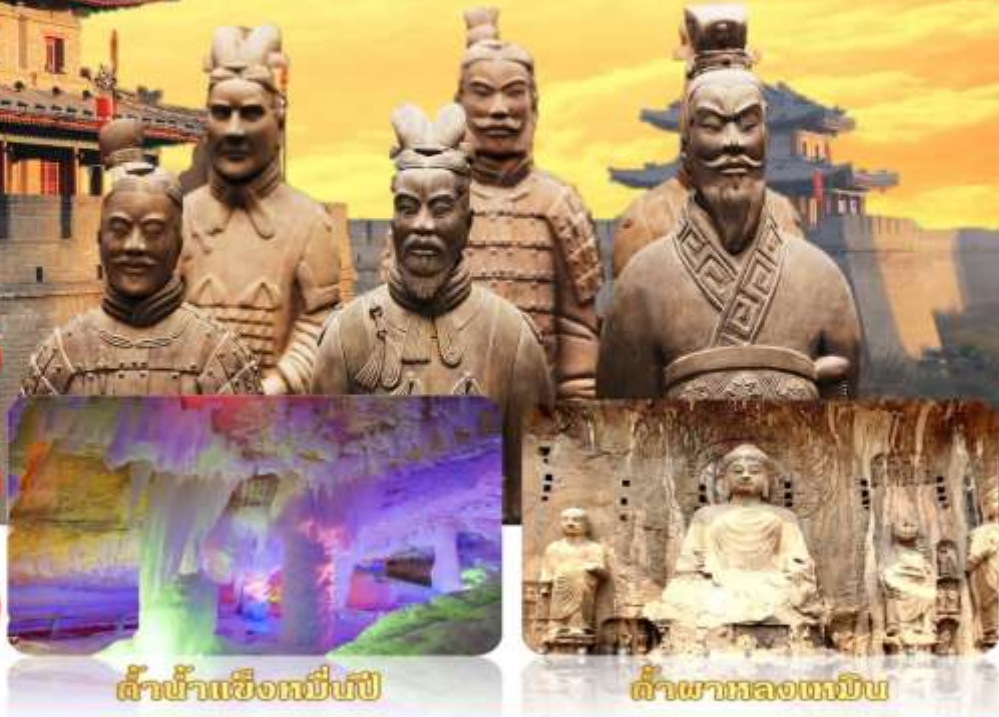
ถ้ำน้ำแข็งหมิงเป่ย์