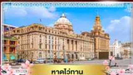
หาดไถ่ทวน

"ชมดอกซากุระนลิบาน ณ แดนมังกร" ล่องเรือทะเลสาบตะวันตก ไข่มุกแห่งหางโจว