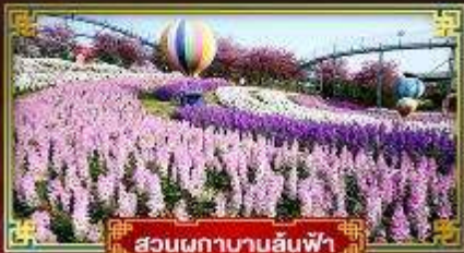
สวนผกานานสีฟ้า